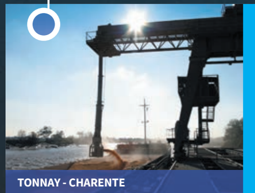
TONNAY - CHARENTE